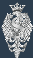
MARZAŁEK SENATU RZECZYPOSPOLITEJ POLSKIEJ STANISŁAW KARCZEWSKI